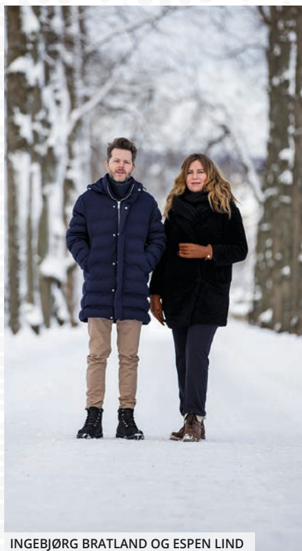
INGEBJØRG BRATLAND OG ESPEN LIND