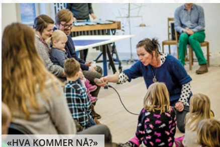
«HVA KOMMER NÅ?»

Arr.: Sortland Museum/Kulturfabrikken Sortland KF/Sortland jazz- og viseklubb