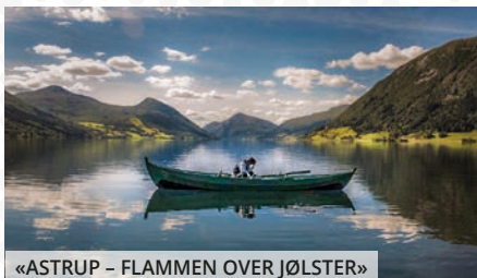
«ASTRUP – FLAMMEN OVER JØLSTER»

Utstillinga er satt sammen av maleri laget av 5-åringene i barnehagen, og er en tradisjon i Lykkentreff barnehage. Utstillinga i år er nummer 20! Oppgaven har vært å male noe som den enkelte er opptatt av eller liker å gjøre. Gjennom bildene vil vi vise barnas uttrykk og kultur. Temaet «Æ» åpner for det enkelte barns individuelle tolking og viser også mangfold og felleskap. Arr.: Lykkentreff barnehage