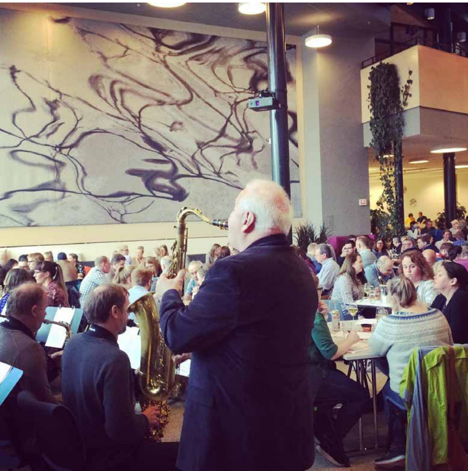
Vesterålen Storband spiller på Lønningsquiz.

fordypningstilbud til spesielt musikkinteressert ungdom. Ulike kurs i regional regi bygger rundt, eller utfyller de faste tilbudene. Ensemble Blå – distriktsmusikerne i Sortland Ensemble Blå er distriktsmusikere i Sortland. Alle musikerne i trioen har stillinger hvor de kombinerer utøvende og pedagogisk virksomhet med ei 50 – 50 fordeling. Ensemble Blå sin visjon er; «Å gi musikalske tjenester av høy kvalitet, både alene og sammen med andre,