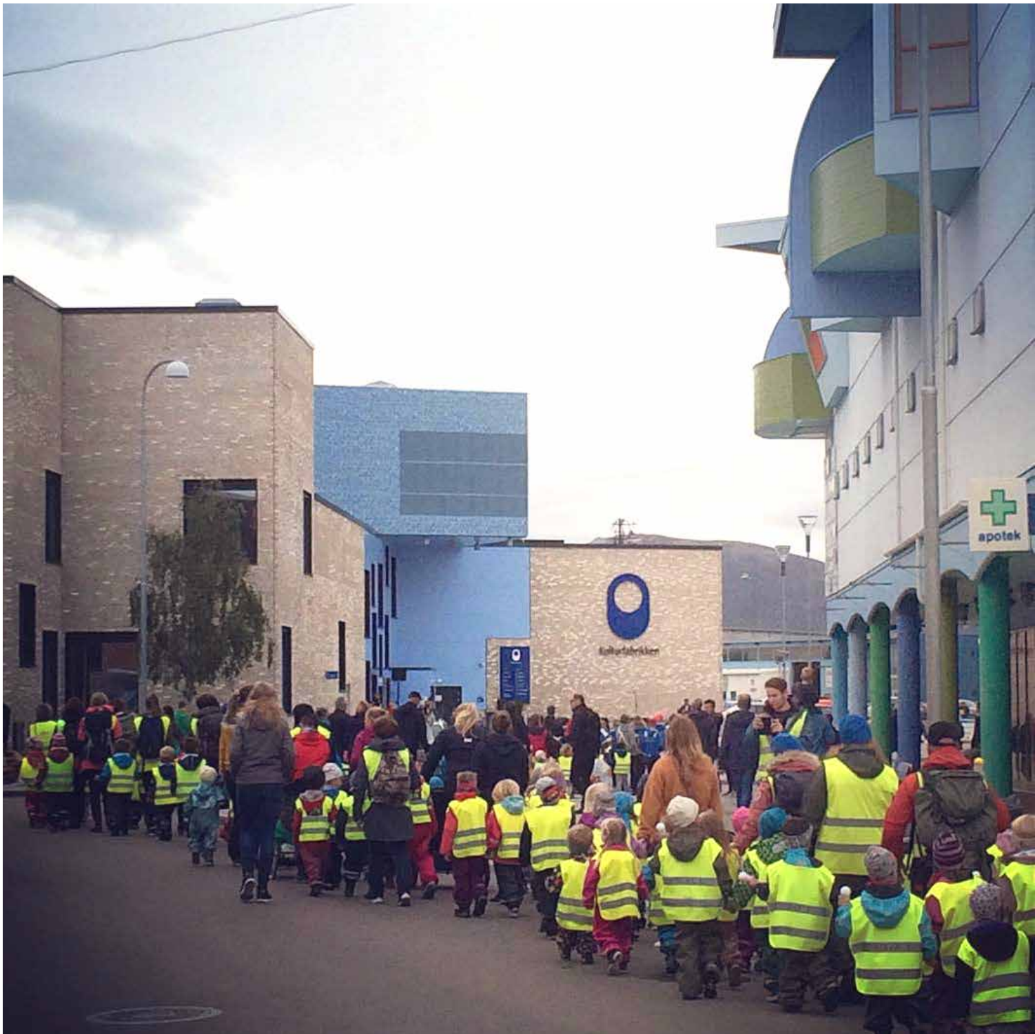
Barnehage- og skoleunger i jazzfestivalparade - og så er det konsert!

som kan utvikles gjennom opplæring. Kulturskolen gir opplæring av høy faglig og pedagogisk kvalitet til barn og unge som ønsker det. Formålet med opplæringa er å lære, oppleve, skape og formidle kulturelle og kunstneriske uttrykk. Opplæringa skal bidra til barn og unges danning, fremme respekt for andres kulturelle tilhørighet, bevisstgjøre egen identitet, bli kritisk reflekterende og utvikle egen livskompetanse.