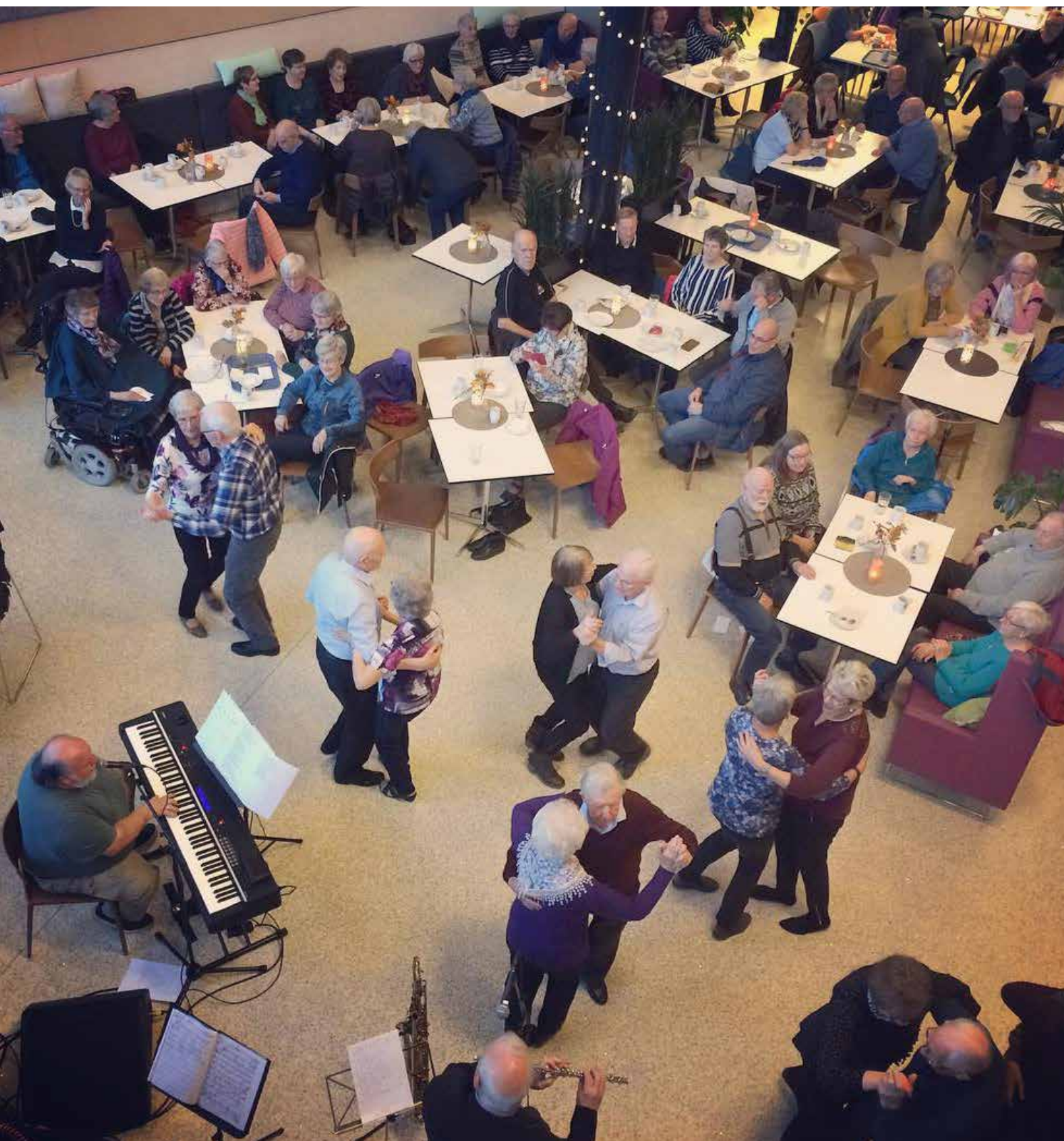
Nedenfor: Te-dans i Kulturkaféen.