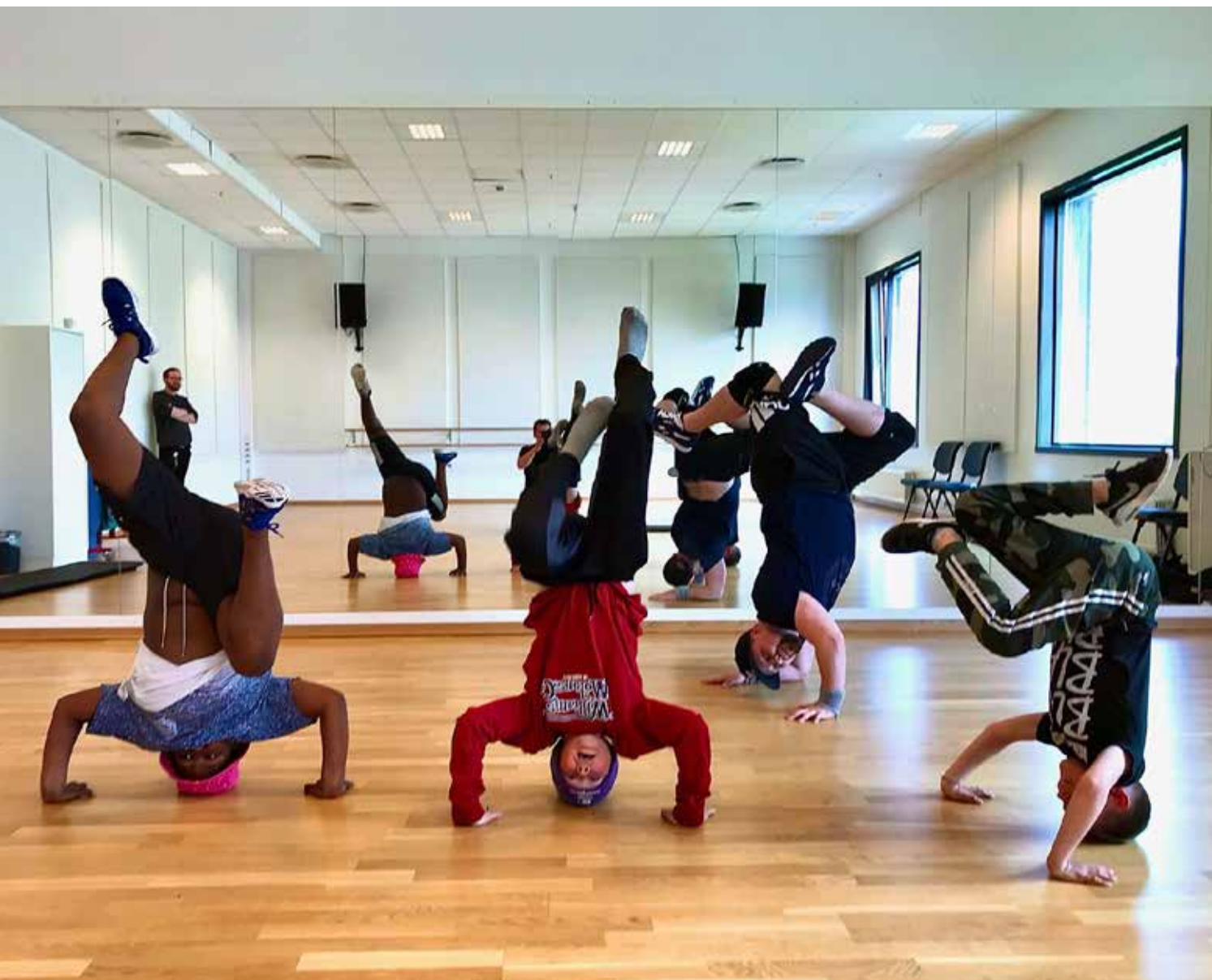
Breakdanskurs med Ungdomsfabrikken.

Forsiden: Populært at Klubben åpnet igjen i 2021.